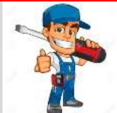
Ρούλης Κατσαβιδάκιος Ηλεκτρολόγος