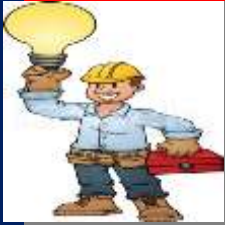
Λάμπης Ηλεκτρολογίδης Ηλεκτρολόγος