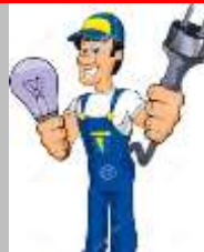
Τάσος Λαμπίδης Ηλεκτρολόγος